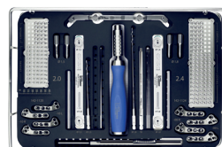
2.0/2.4 TPLO Set, Edelstahl Produkt Code: 142-0150-00