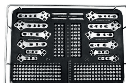
2.7/3.5 TPLO Set, Edelstahl Produkt Code: 142-0100-02