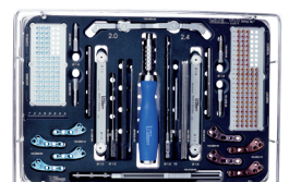
2.0/2.4 TPLO Swing Set, Titan Produkt Code: 142-2820-24